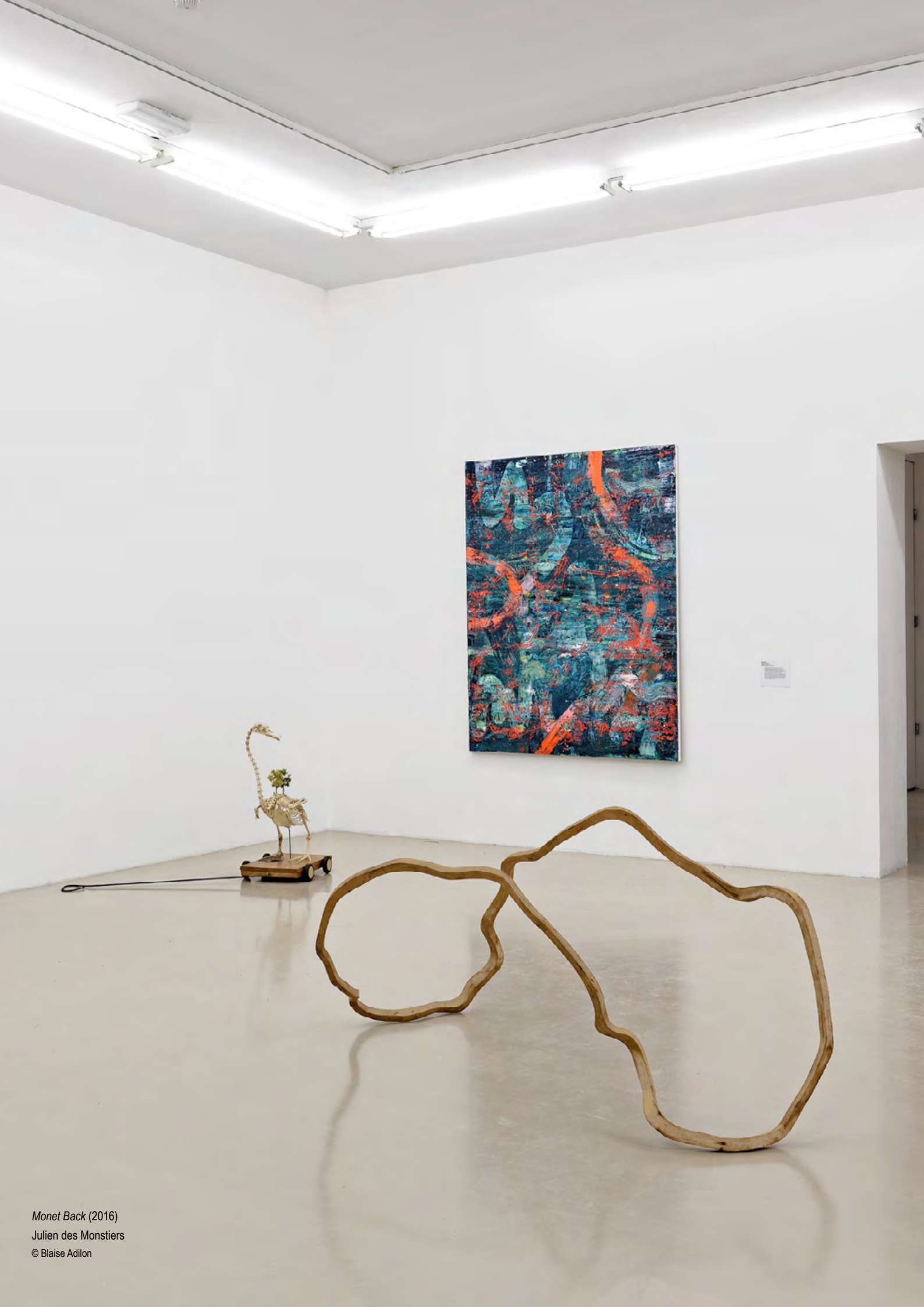
Monet Back (2016) Julien des Monstiers