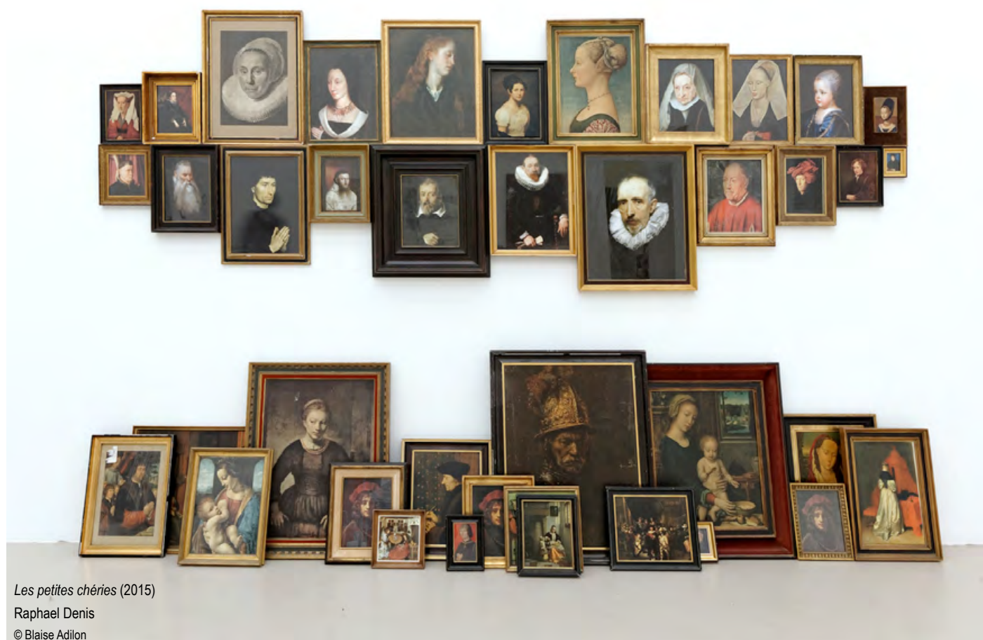
Les petites chéries (2015)