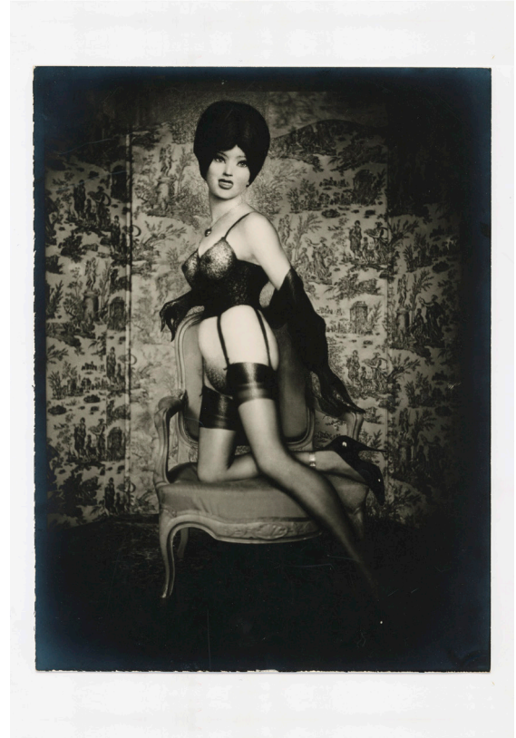
Pierre Molinier Effigie , 1967 Vintage silver print, 24 x 18 cm