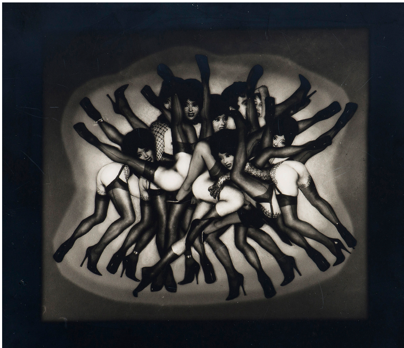
Pierre Molinier, Grande Mêlée , 1968. Vintage silver print on soft Apga. 23 x 27 cm.

JANUARY 16 – MARCH 1, 2025 ————— EXHIBITION