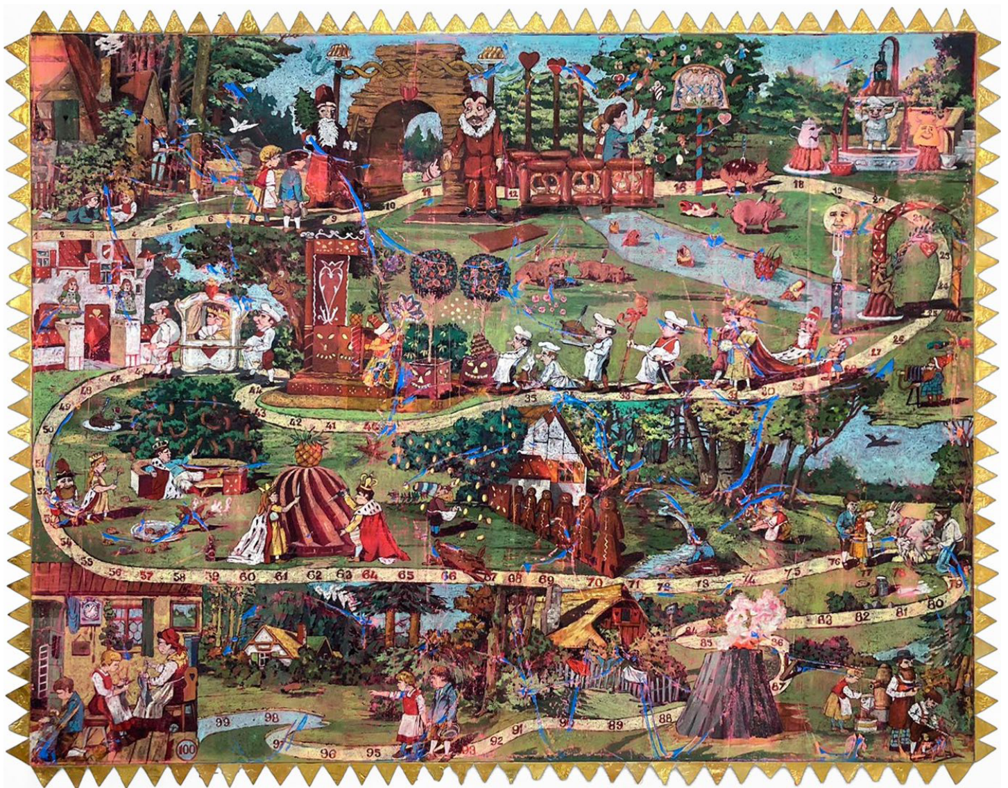
Julien des Monstiers, Plateau XXI , 2025, oil on canvas, circa 220 x 170 cm

GALERIE CHRISTOPHE GAILLARD, PARIS, FRONT SPACE 11.10 - 08.11.2025