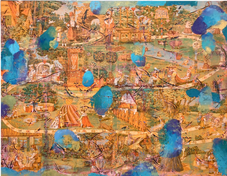
Julien des Monstiers Plateau XXI , 2025 Oil on canvas 220 x 170 cm

Between chance and strategy, progression and accident, the artist reminds us that playing — and painting — are two ways of entering a world that is both codified and open, where each gesture engages a collective and intimate narrative.