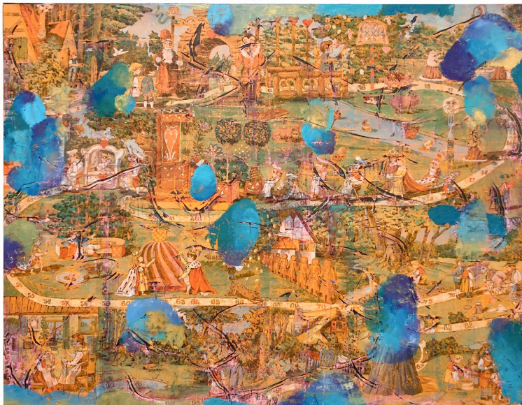
Julien des Monstiers Plateau XXI , 2025 Huile sur toile 220 x 170 cm

Entre hasard et stratégie, progression et accident, l'artiste nous rappelle que jouer — et peindre — sont deux manières d'entrer dans un monde à la fois codifié et ouvert, où chaque geste engage un récit collectif et intime.