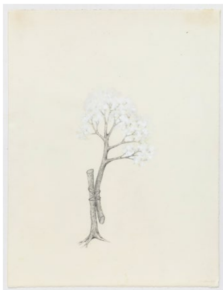
Nancy Brooks Brody Tied Tree , 2001 Stylo et gouache sur papier Rives BFK 76,2 x 56,5 cm ©Nancy Brooks Brody [NBB711CF]

Galerie Christophe Gaillard Paris, Bruxelles, Le Tremblay