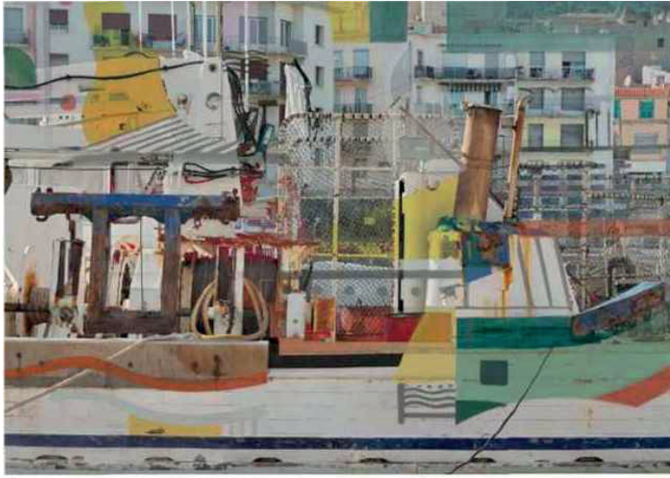
Stéphane Couturier, Sète n°4 , 2018, tirage jet d'encre. © Stéphane Couturier.

tableau et opère de nouvelles combinatoires. « Je pars de réelles prises de vue, mais l'approche documentaire est ensuite déconstruite pour reconstruire, grâce à l'outil numérique, une nouvelle réalité, à la fois dynamique et chahutée. Nous vivons dans une époque où il existe une mise en doute généralisée des images. La photo constitue pour moi un réservoir de formes et non pas un réservoir de vue privilégié sur le monde », poursuit Stéphane Couturier.