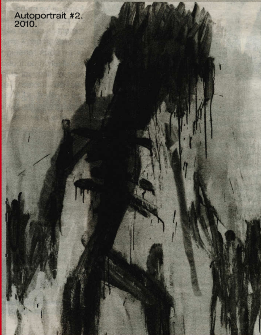
Autoportrait #2. 2010.