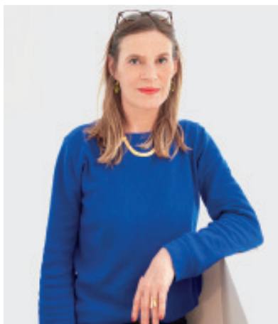
Mire #1 , 2006, épreuve chromogène, 98 x 116 cm.