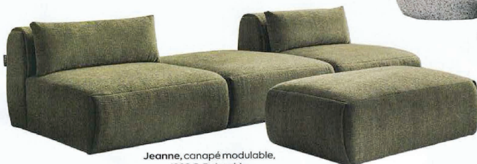
Jeanne, canapé modulable, 1399 €, Bobochic.