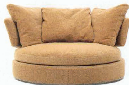
Amoenus. Design Antonio Citterio, à partir de 7879,20 €, Maxalto.