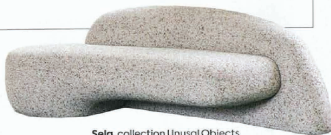
Sela, collection Unusal Objects, prix sur demande, Bina Baitel.