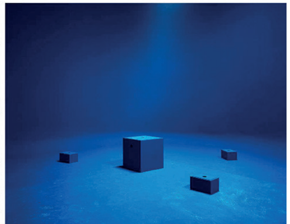
Marina Gadonneix, Rock and sand,

série « Remote control », 2005, Gadonneix C-Print, 98 x 116 cm.