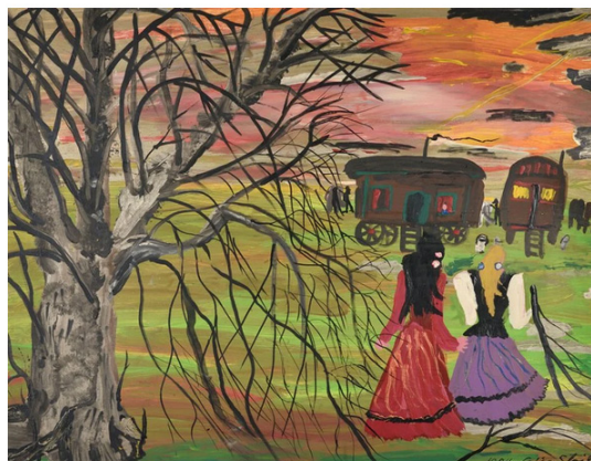
Ceija Stojka, Sans titre, 1994 ⓘ

C'est désormais chose faite, et la réussite est de taille. Au musée des Beaux-Arts, les commissaires Amandine Royer et Vincent Briand ont fait le choix d'un parcours non chronologique, qui regroupe les œuvres par thèmes, motifs, obsessions , pourrait-on dire, et rythmé par les vers de Stojka, inscrits sur les murs et constamment cités dans les cartels des œuvres. L'approche est dense, minutieuse, généreuse, et on sort de l'exposition en ayant l'impression d'avoir véritablement rencontré l'artiste , de l'avoir vu peindre, écrire, parler et même chanter, grâce à un court documentaire. Le musée de la Résistance et de la Déportation complète avec un autre film , plus long, et un commissariat partagé entre les deux institutions.