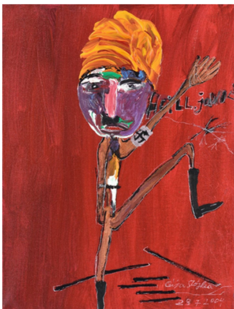
Ceija Stojka, Der Tanz auf dem Hakenkreuz [Danse sur la croix gammée], 28 juillet 2004