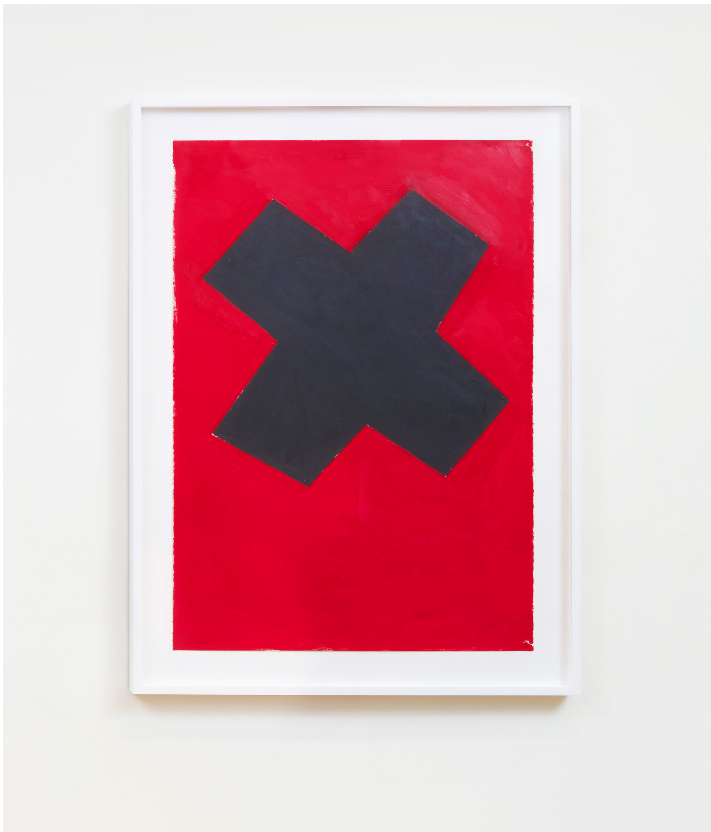
Richard Nonas, Sans titre , 2003, Acrylique sur papier, 110.5 x 76.2 cm. Courtesy The Estate of Richard Nonas & Galerie Christophe Gaillard. © Rebecca Fanuele

L'Officiel Galeries & Musées - 2 juin 2026 Richard Nonas à la Galerie Christophe Gaillard par Chloé Hamon