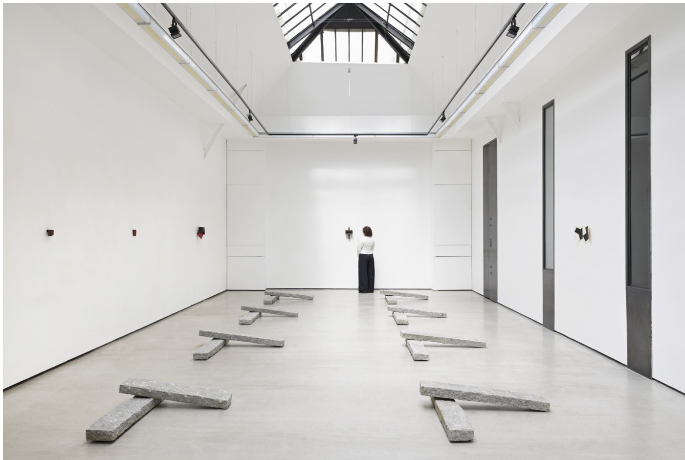
Vue de l'exposition Richard Nonas, Galerie Christophe Gaillard, Paris, 2026.

Chez Richard Nonas, la sculpture n'est jamais décorative : elle agit sur et avec l'espace. Les pièces réalisées en acier ou en granit, installées au mur ou à même le sol, dialoguent entre elles, capables de modifier notre perception de l'espace. L'artiste parle d'ailleurs plutôt d'énergie que de composition. Ses sculptures instaurent des tensions, des circulations invisibles et des rythmes silencieux qui engagent directement le corps du spectateur.