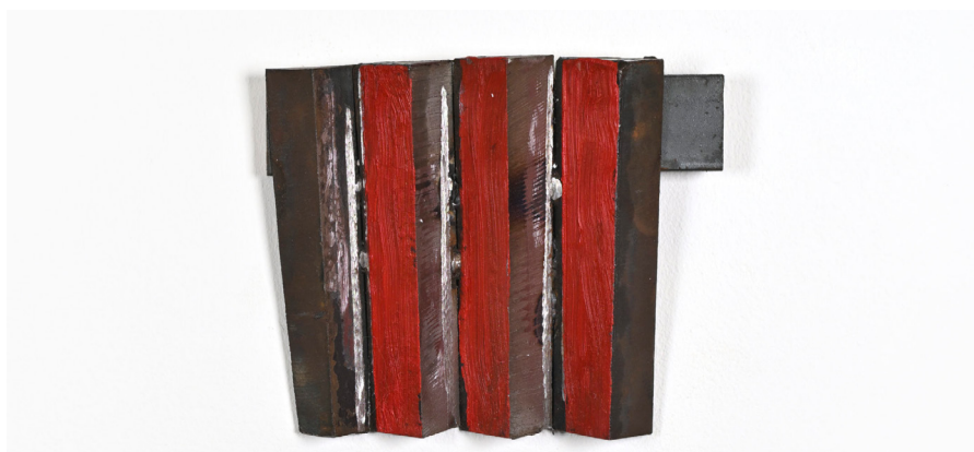
Richard Nonas, Sans titre , 2016, Métal, peinture, 12.7 x 10.2 x 2.5 cm, Courtesy The Estate of Richard Nonas & Galerie Christophe Gaillard, © Rebecca Fanuele

Pourtant, l'artiste s'éloigne rapidement de cette tradition par la dimension humaine et spirituelle qu'il insuffle à ses œuvres. Anthropologue de formation, Richard Nonas a vécu auprès de communautés autochtones en Amérique du Nord dans les années 1960, et cette expérience marque sa vision de l'art, qu'il considère comme une force culturelle et énergétique plutôt que comme un simple objet esthétique.