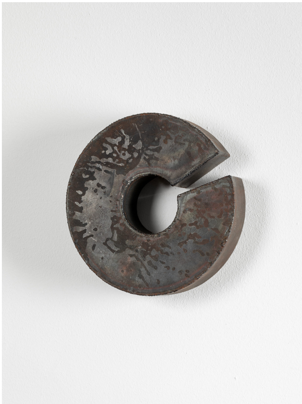
Richard Nonas, Untitled , 1992, Acier, 6.4 x 17.8 x 17.8 cm. Courtesy The Estate of Richard Nonas & Galerie Christophe Gaillard, © Rebecca Fanuele

L'exposition met également en lumière la dimension critique de son travail. Face à une modernité qu'il juge désincarnée et rationaliste, Richard Nonas réaffirme la capacité de l'art à redonner du sens à notre environnement. Ses sculptures ne cherchent pas à imposer un discours, mais à ouvrir une expérience.