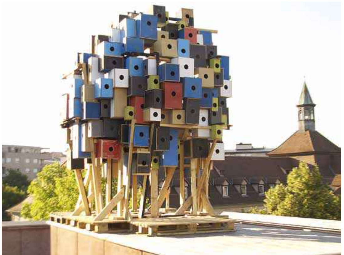
Vincent Chevillon, Les Hauts-parleurs . Installation éphémère sur la terrasse du barrage Vauban, 295 nichoirs, Strasbourg, 2015 © Vincent Chevillon

Vincent Chevillon est un jeune artiste français qui lie, dans sa pratique, les sciences naturelles et les sciences humaines. Travaillant sur l'errance, le voyage, les identités et la nature, à travers une mythologie marquée par les découvertes du XIXème siècle, l'artiste mêle passé, présent et futur. (p. 11)